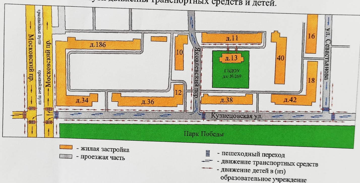
План-схема района расположения ГБДОУ д/с №269, пути движения транспортных средств и детей.